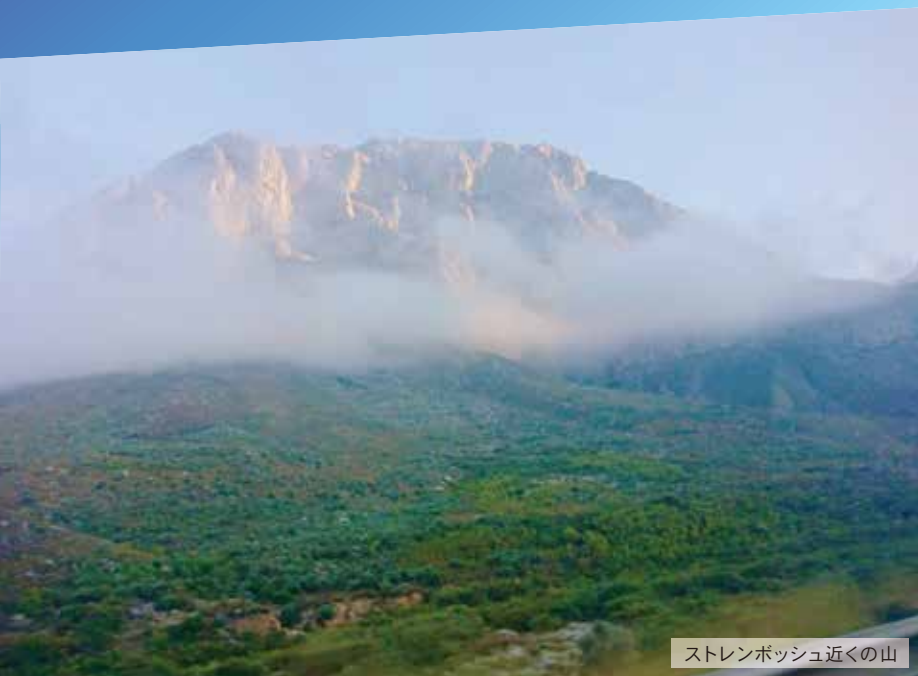
ストレンボッシュ近くの山