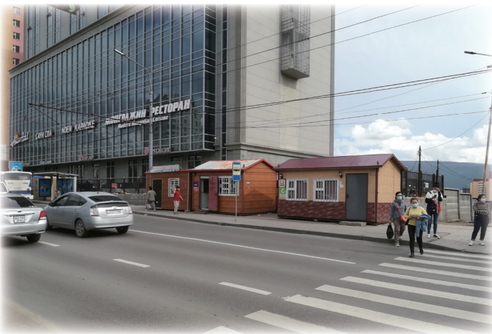
街なかのキオスクはこんな感じです

翌日聞くと、キオスクのオーナーは来なかった、翌々日に聞くと来週来ることになった、翌週に聞くと、と支払い期限がどんどん先送りになりました。その間すでに働き始めた彼はキオスクの売上金をためていて130万になった、