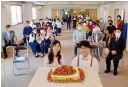
2階ホールでの結婚祝会

行うことができている。またこの春から教会学校を再開することもできました。活動自粛という足かせの中で、私たちがしたことは、神さまに期待して祈り続けることでした。その中で洗礼者も与えられ、転入者や求道者も加えられていることは、主の祝福としか言いようがありません。 今年の教会の主題は「とこしえの祝福」です。人の思いや考えを超える主の祝福を期待して、これからもみことばと祈りによつて歩み続けたいと願わされています。 「主よ。あなたが祝福してくださいました。あなたのしもべの家はとこしえに祝福されています。」―歴代誌17章27節