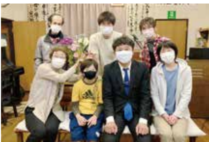
今年4月の礼拝後に

転勤による転出者も多かった教会です。最近では近所の子どもたちが平日にも教会へ遊びに来ています。皆さまのお祈りやご支援に感謝申し上げます。会員の友人の方々も時々礼拝に出席しています。それらの方々が主と教会につながることができまますよう続けての助け、近所の子どもたちや近隣地域の中からも多くの信じ救われる次世代を主が送ってくださいませよう、教会学校の再開や少人数ならではの一人ひとりへの傾聴や祈りと愛の交わり、しっかりと信託教育が与えられ施されますよう、教会の将来の存続や継承や自立のため、続けてお祈りに覚えていただき応援をいただきたいと思います。