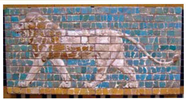
バビロンの行進路レリーフ

「いちじくの木は花を咲かせず、 ぶどうの木には実りがなく、 オリーブの木も実がなく、 畑は食物を生み出さない。 羊は囲いから絶え、 牛は牛舎にいなくなる。 しかし、私は主にあって喜び躍り、 わが救いの神にあって楽しもう。 私の主、神は、私の力。 私の足を雌鹿のようにし、 私に高い所を歩ませる。」 ハバクク書3章17-19節