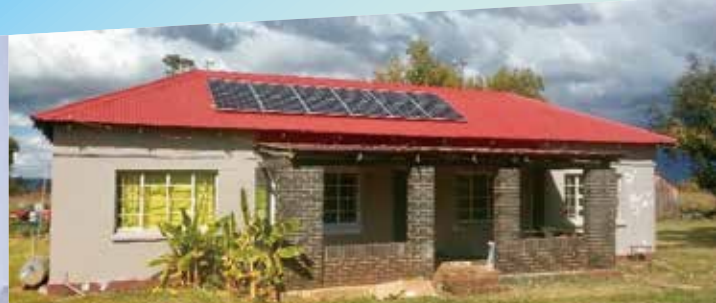
改修中の農場住宅 (ポチェフストロム)